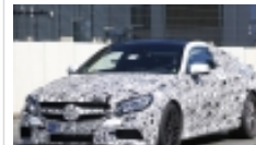
FOTO MERCEDES Mercedes C63 AMG Coupe 2016 - Foto spia 22-04-2015

FOTO MERCEDES Mercedes - Nuovi cerchi 2015